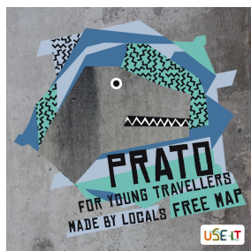
copertina 2016 use it Prato