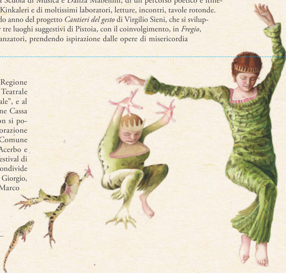
Illustrazione di Fabian Negrin tratta dal volume Tutte le fiabe , di Jacob e Wilhelm Grimm © 2015 Donzelli Editore

Presidente Associazione Teatrale Pistoiese